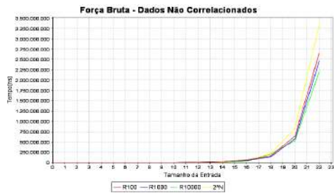
Figura 1: Comportamento da Força Bruta

O comportamento de cada algoritmo com relação ao tamanho da entrada fornecida e o tempo gasto de processamento na escala dos nano segundos são mostrados na Figura 1, Figura 2, Figura 3 e Figura 4.