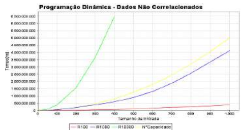
Figura 2: Comportamento da Programação Dinâmica